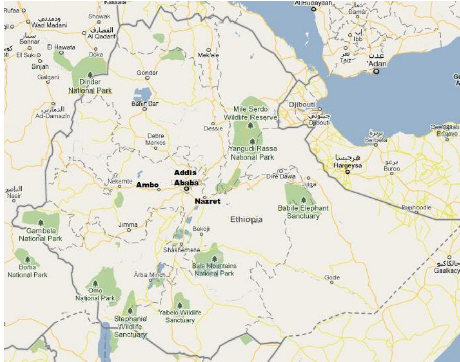
ሰዕል1: - የአዳማ/ናዝሬት ከተማ ከአዳስ አበባ አንጻራዊ ማኛ/ Location/